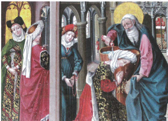
Erwachsenentaufen gab es auch früher, wie hier auf dem Bild aus der Lüneburger St. Nicolai Kirche zu sehen ist.

Ostergottesdienst mit Taufen in der Klosterkirche Lüne